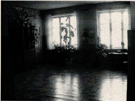
Φοτο Νο 9