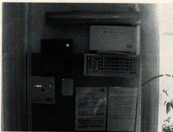
Φοτο Νο 13