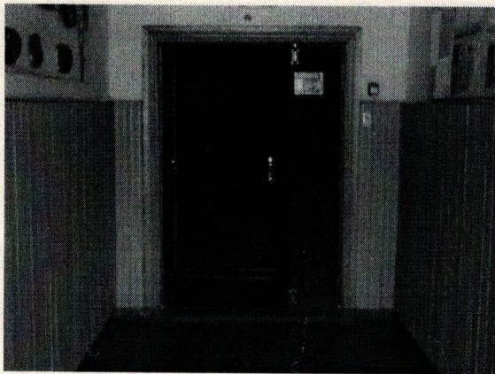
Φοτο Νο 5