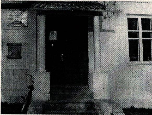
Φοτο Νο 3