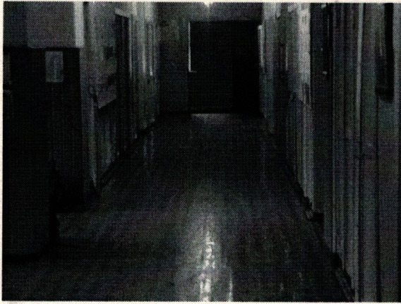
Φοτο Νο 7