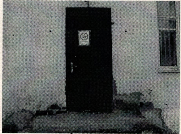
Φοτο Νο 4