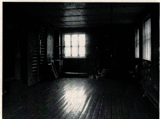
Φοτο Νο 12