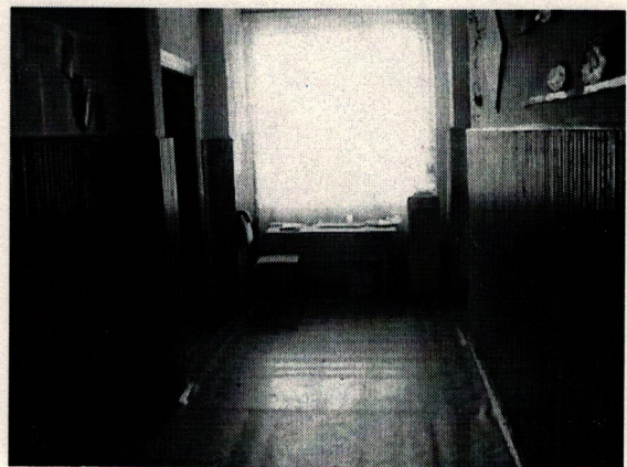
Φοτο Νο 6