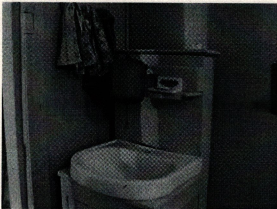
Φοτο Νο 11