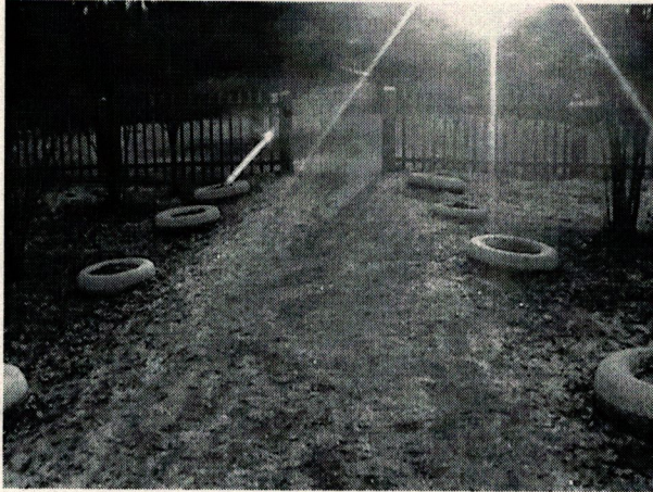
Φοτο Νο 1