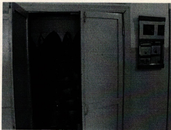
Φοτο Νο 14