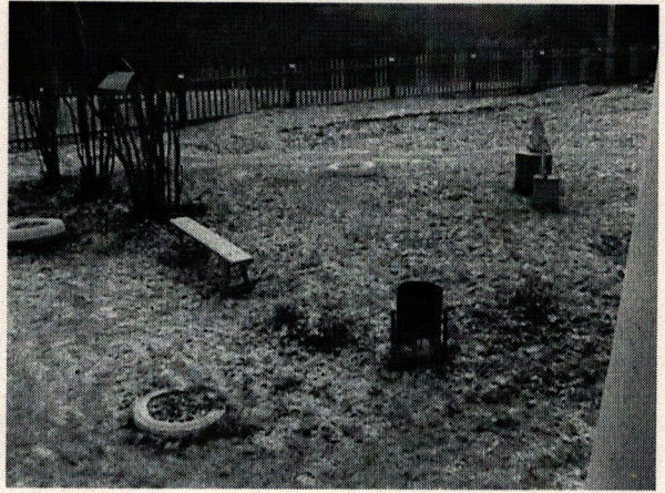
Φοτο Νο 2