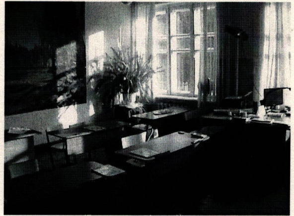
Φοτο Νο 8